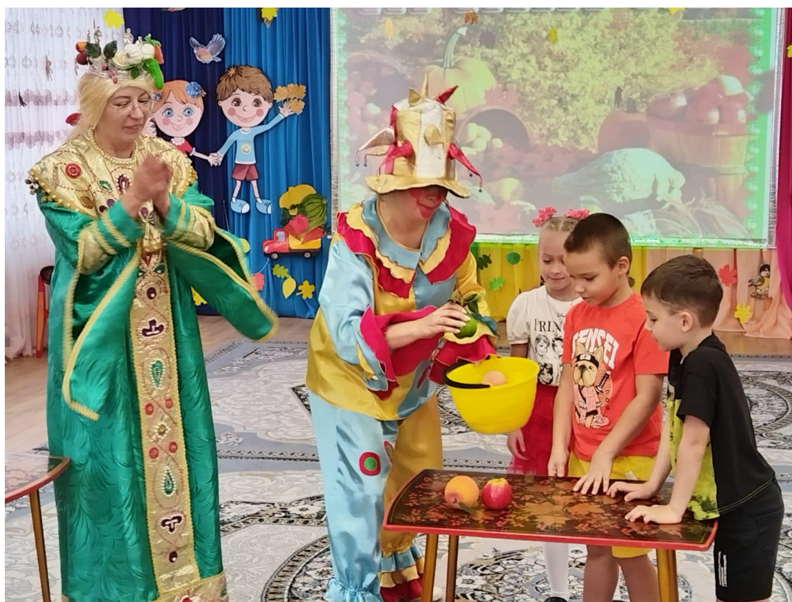
Фото 2. Игра «Овощи-фрукты-ягоды»