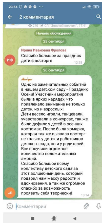
Фото 8 Отзывы воспитателей и родителей