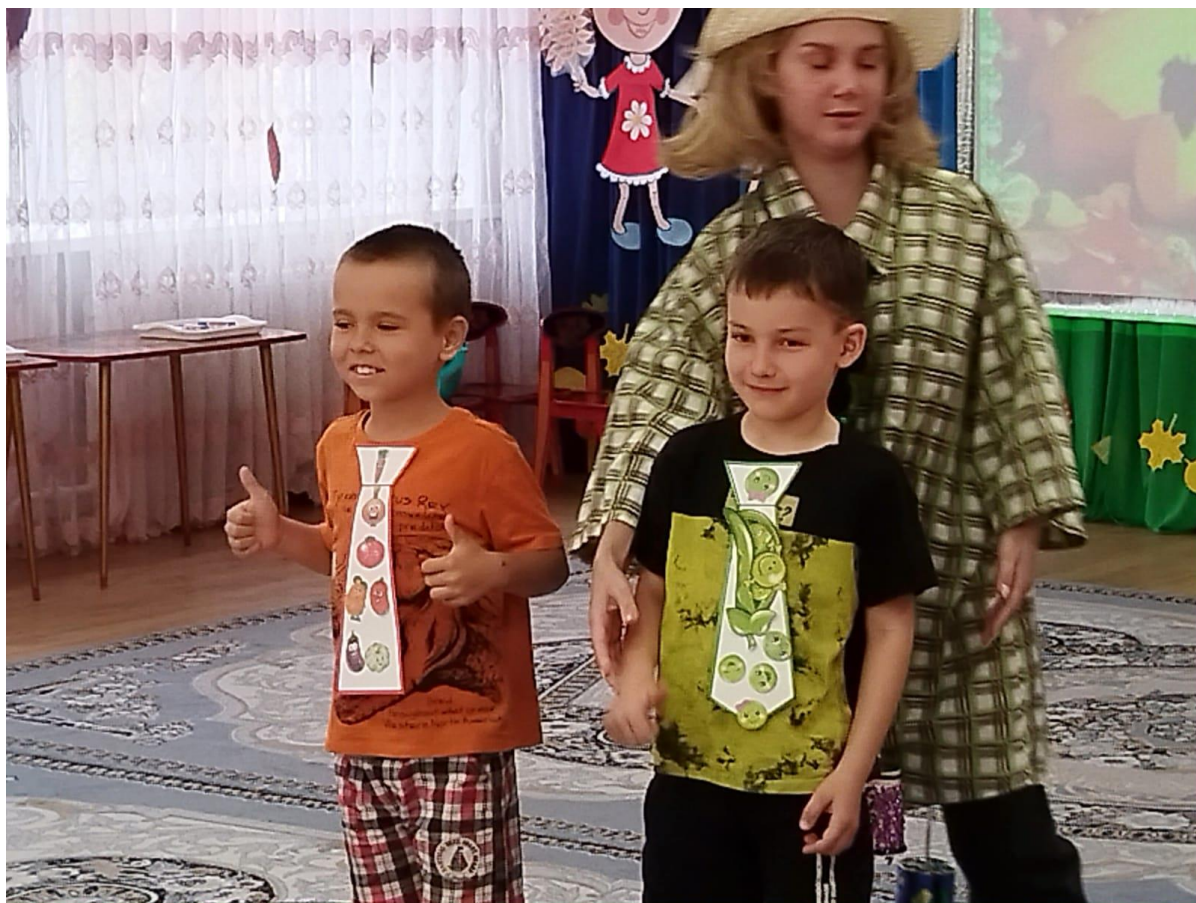
Фото 5. Дефиле галстуков