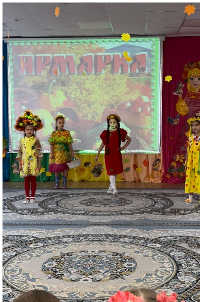
Фото 4. Дефиле костюмов