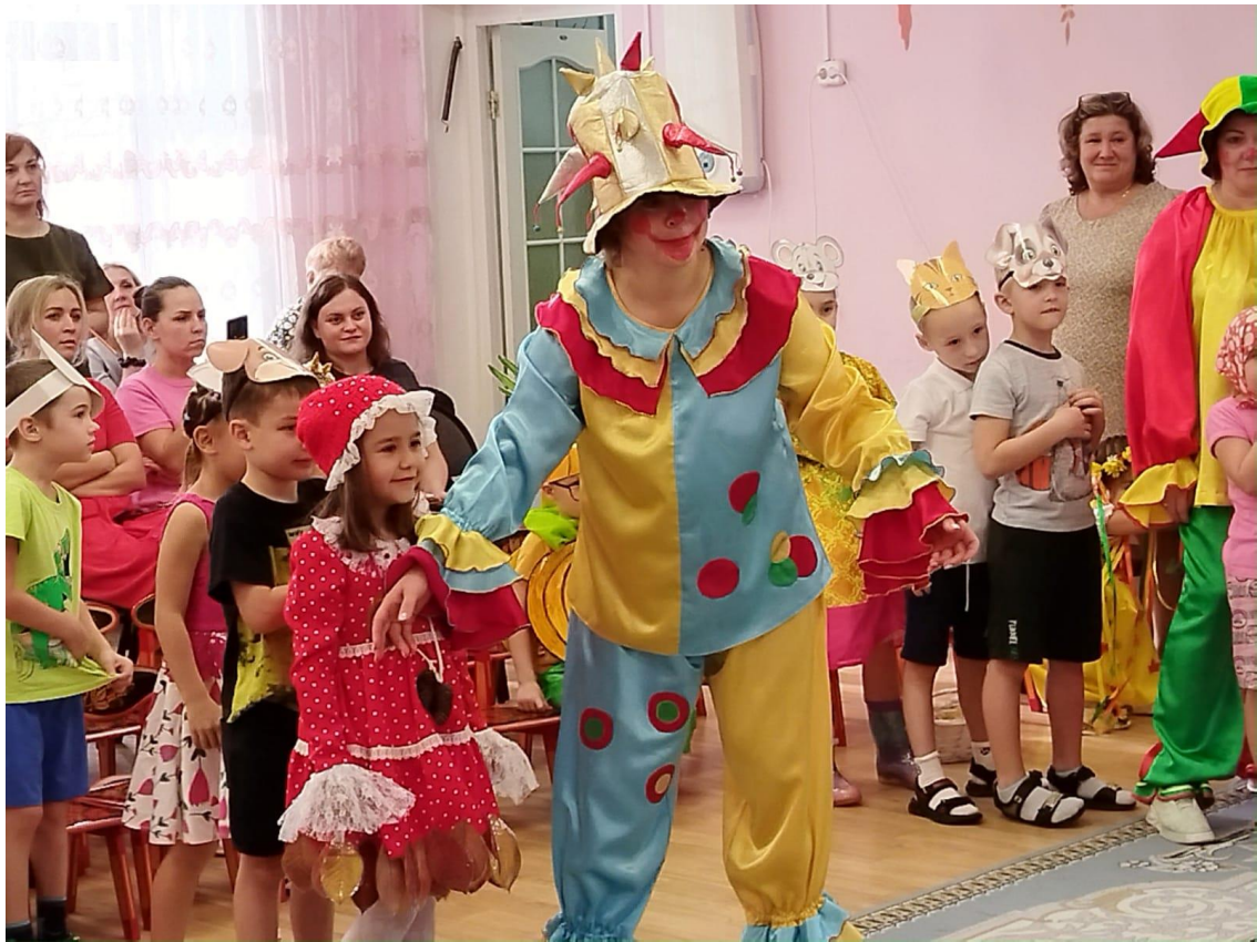
Фото 3. Игра «Репка»