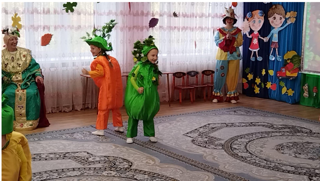
Фото 1. Танец «Веселых овощей»