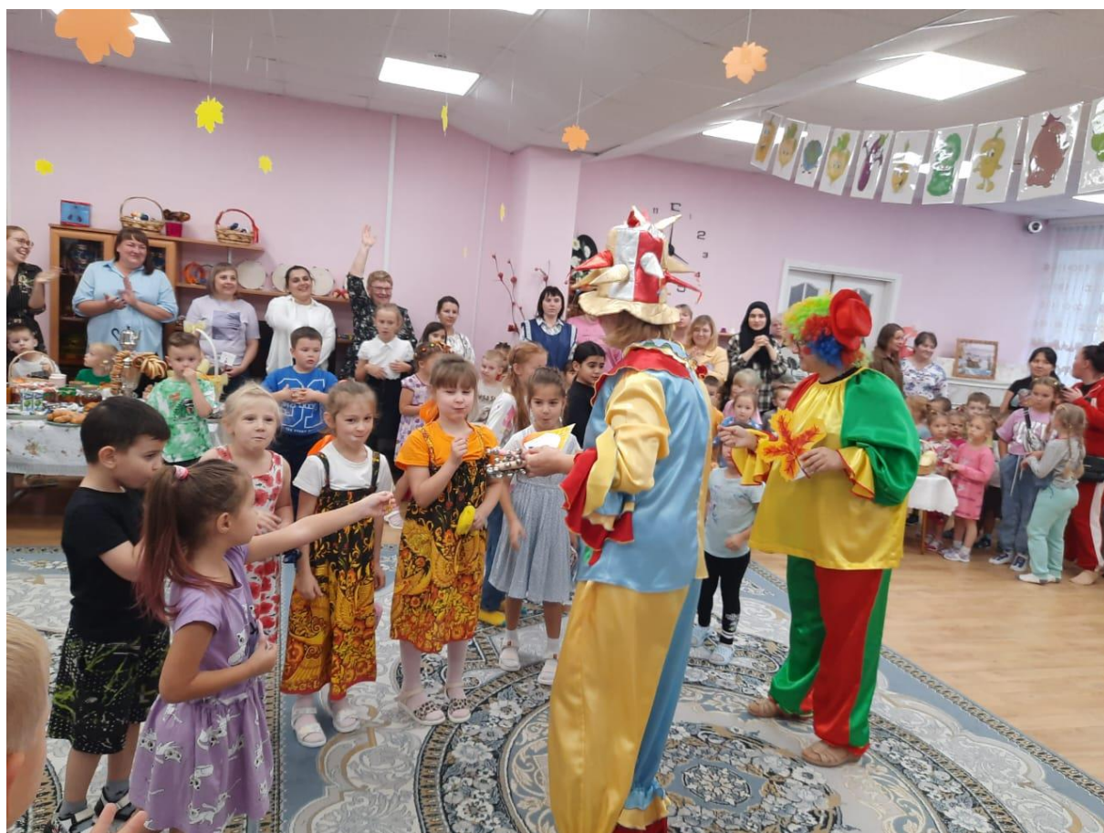
Фото 6 Выбраны помощники - огородники для Игры «Кто, что продает»