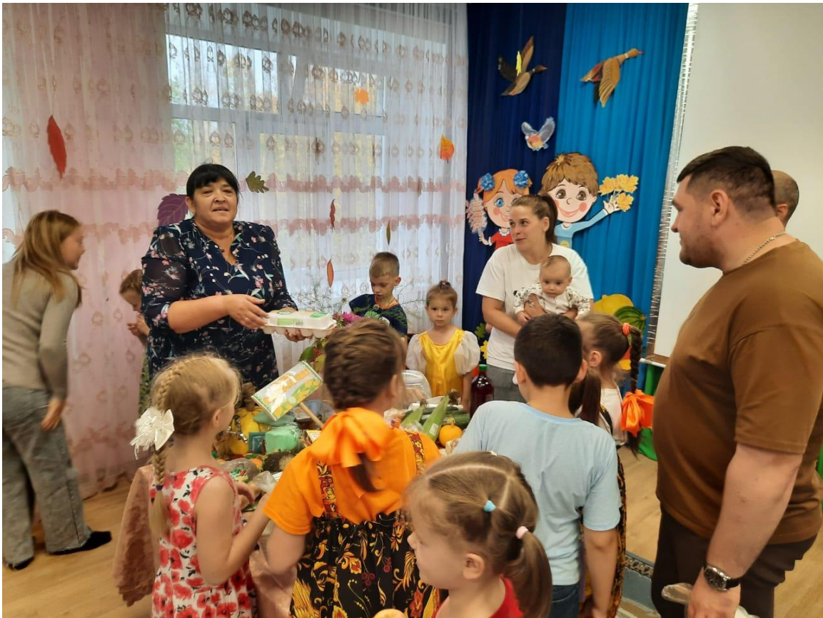
Фото 7 Налетайте! Налетайте! Покупайте! Покупайте!